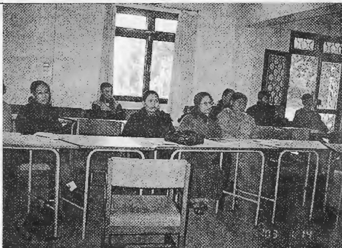
एट्वीनद्वारा आयोजित प्रहरी महिला सेलसँगको कार्यशाला

ढाकामा सम्पन्न दक्षिण एसियाली महिला अदालतमा उठाइएका सवालहरु, निर्णय र आगामी दिनमा गनुपर्ने कार्यहरुबारे छलफल गर्ने उद्देश्यले सञ्चारकर्मीहरूसँग अन्तरक्रिया ०६० भदौ ७ गते काठमाण्डौमा सम्पन्न गरियो।