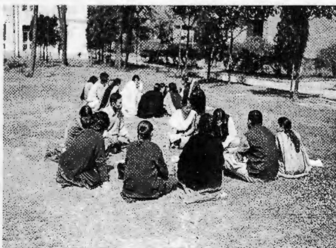
एट्वीन पाँच वर्षे समीक्षा बैठक

बेचबिखन विरुद्धको अभियानमा कानूनी अधिकार स्थापनाको अवसर र चुनौती विषयक अन्तक्रिया कार्यक्रम २०६०, साउन १८ गते ललितपुरको स्टाफ कलेजमा सम्पन्न गरियो। उक्त अवसरमा २०६० साउन १९ गते पत्रकार सम्मेलनको आयोजना गरिएको थियो। पत्रकार सम्मेलन ललितपुरको पुल्चोकमा सम्पन्न गरियो।