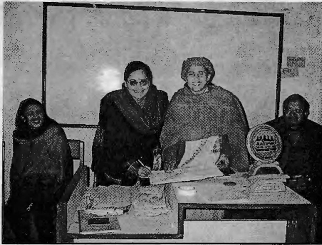
एट्वीन सचिवालय हस्तान्तरण कार्यक्रम

गरिएको थियो। ५० जना सञ्चारकर्मीहरूको बीचमा महिला अदालतको बारेमा जानकारी दिने र नेपालका तर्फबाट उठाइने सवालहरूबारे जानकारी दिइएको थियो।